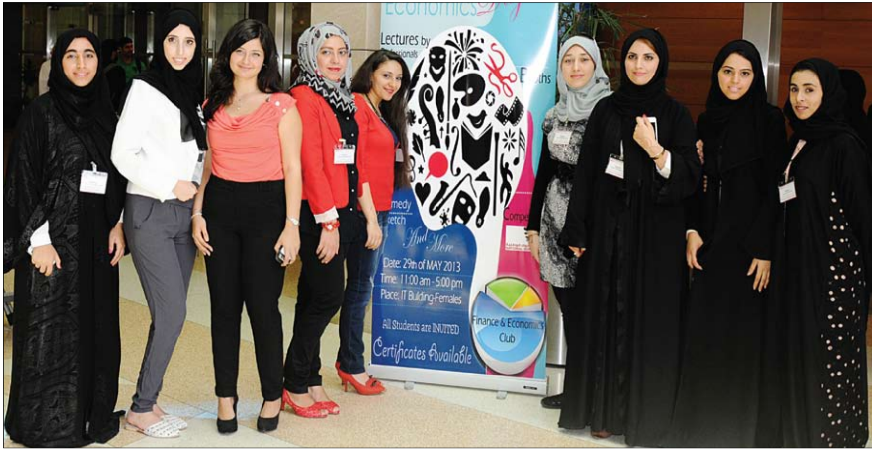
يهدف التعرف على سوق العمل